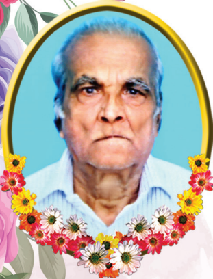
കല്ലറയ്ക്കൽ ചാക്കു മകൻ ആഗസ്തി