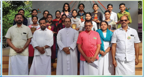
Full A+ winners