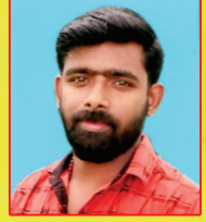
സിന്റോ പൗലോസ് പറമ്പി