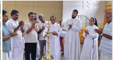
വിൻസന്റ് ഡി പോൾ ഉദ്ഘാടനം