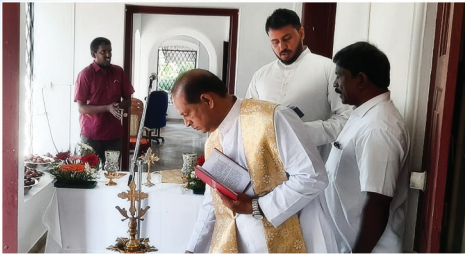
നവീകരിച്ച പള്ളിമേടയുടെ വെണ്ണരിപ്പ്