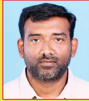
ടിജോ സെബാസ്റ്റ്യൻ കല്ലറയ്ക്കൽ