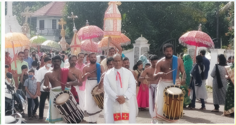
കുരിശിന്റെ പുകഴ്ചയുടെ തിരുനാൾ