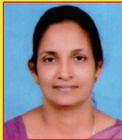
മോളി പോളി മംഗലി