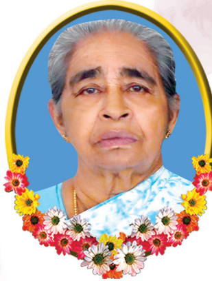
കല്ലറയ്ക്കൽ ആഗസ്തി ഭാര്യ സിസിലി