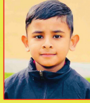
ഏയ്ബൽ ബിനിൽ ചിറമേൽ